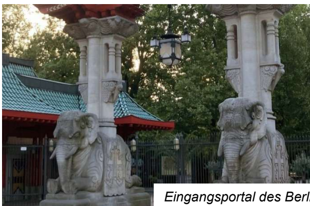
Eingangsportal des Berliner Zoos