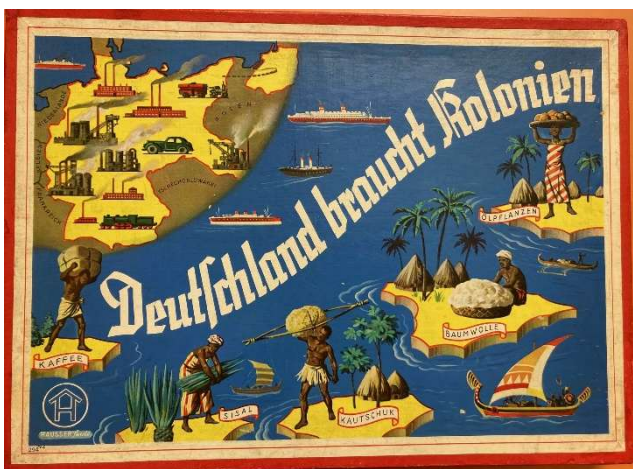
Brettspiel aus den 1930-er Jahren

Berlin ist der ideale Standort, um sich auf Spurensuche des deutschen Kolonialismus zu begeben: die Stadt, die Regierungssitz des deutschen Kaiserreiches war und in der damals weitreichende politische, wirtschaftliche und militärische Entscheidungen getroffen wurden, verfügt wie kaum eine andere über diverse koloniale Erinnerungsorte. Zum anderen ist sie gegenwärtig Schauplatz harter politischer Auseinandersetzungen um das koloniale Erbe Deutschlands. Der Bildungsurlaub wendet sich an Interessierte, die sich in Berlin auf die Spuren des deutschen Kolonialismus begeben möchten.