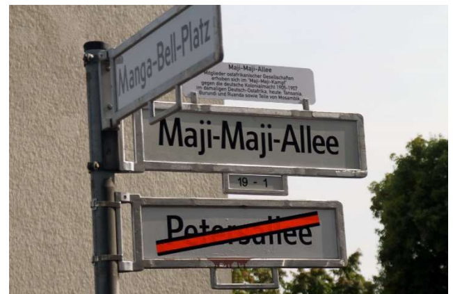
Straßen-Umbenennung im Berliner Afrikanischen Viertel

Das Seminar möchte nicht bewerten und ideologisieren, sondern Informationen zur eigenen Meinungsbildung zur Verfügung stellen. Dabei werden zu medial präsenten und weniger öffentlich diskutierten Themen Hintergrundinformationen erläutert und Zusammenhänge aufgezeigt. Für die Diskussion innerhalb der Seminargruppe bleibt genügend Zeit.