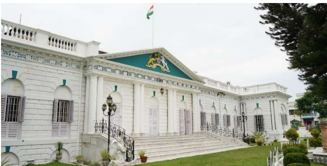
Cossimbazar Palace Hotel

Gruppengröße: Minimale Teilnehmerzahl: 10 | Maximale Teilnehmerzahl: 20