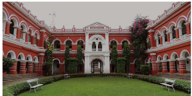
Itachuna Rajbari Hotel